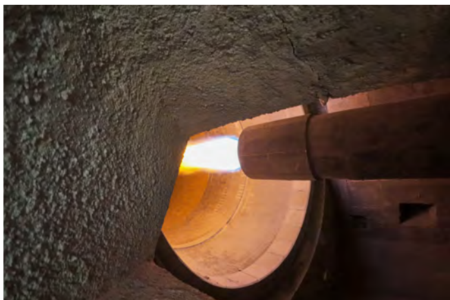
Tuyère du four 6 de la cimenterie d'Airvault : zone d'injection des combustibles à l'origine de la flamme. La température au cœur de la flamme atteint plus de 2 000 °C en fonctionnement à pleine puissance.

Entre la pose de la première pierre et la sortie du premier clinker, soit en 1 289 jours, Heidelberg Materials France a mené à bien un chantier de grande ampleur sur le site d'Airvault. Sur une superficie de 21 hectares, le projet a mobilisé jusqu'à 700 personnes par jour au pic de l'activité, avec 18 000 tonnes d'acier et 38 000 m 3 de béton mis en œuvre pour construire une nouvelle cimenterie complète autour du nouveau four 6.