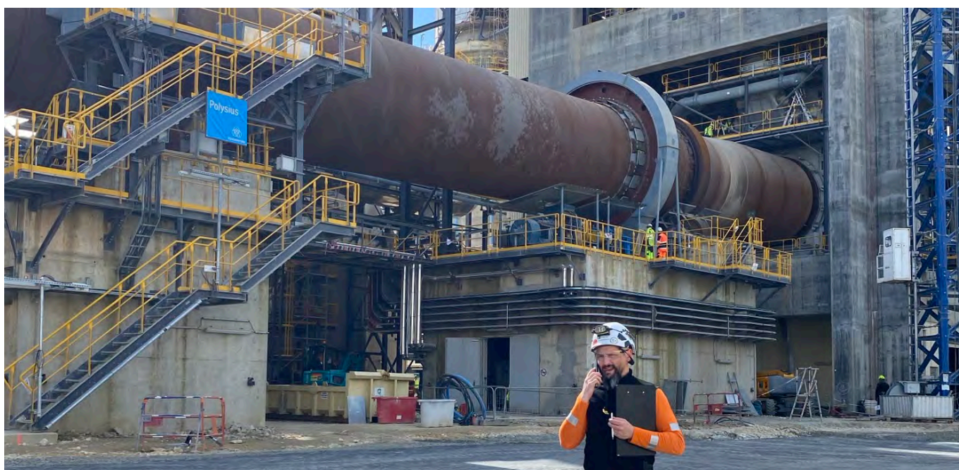
Vue du nouveau four de la cimenterie d'Airvault et de ses équipements associés, avec un collaborateur sur site lors des opérations de mise en service.

Heidelberg Materials France annonce la mise en service de la nouvelle ligne de cuisson (four 6) de sa cimenterie à Airvault (79), modernisée dans sa quasi-intégralité. Pour rappel, la modernisation du site visait notamment à remplacer les deux anciennes lignes de cuisson à voie semi-sèche par une nouvelle ligne à voie sèche avec précalcinateur, d'une capacité de 4 000 tonnes par jour.