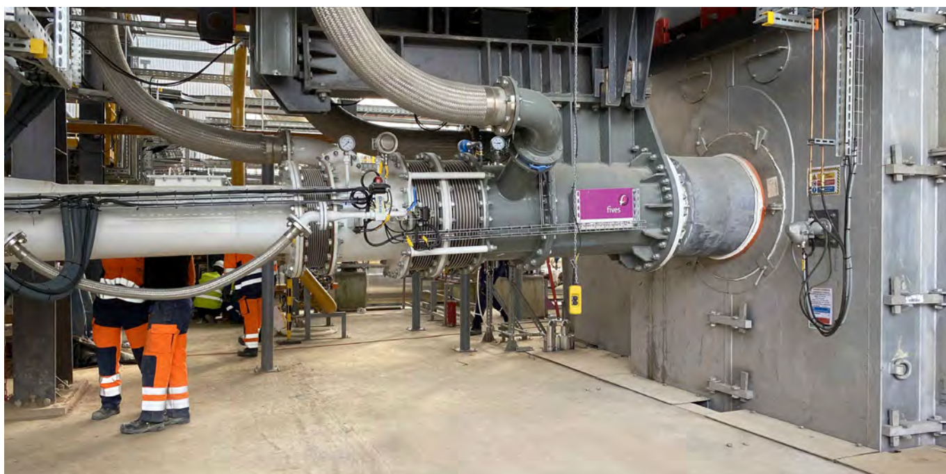
Tuyère du four 6 de la cimenterie d'Airvault : équipement clé assurant une partie de l'apport thermique nécessaire au procédé de fabrication du clinker.